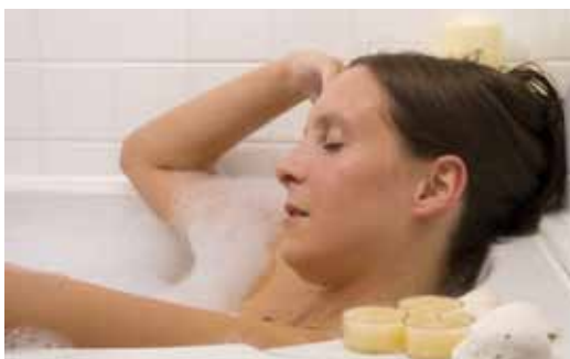
... oder bei einem heißen Bad